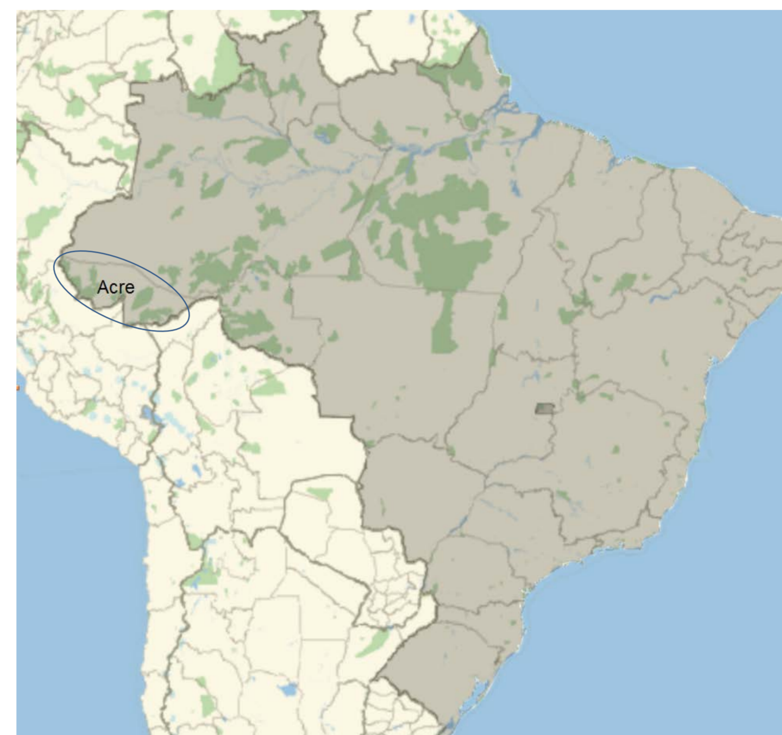
Figura 1. Estado do Acre, destacado por uma elipse. Amazônia, Brasil.

O Instituto Nacional de Meteorologia (INMET), como produto do monitoramento meteorológico de longo prazo, elaborou climatologias, em particular das chuvas, de várias áreas do Brasil. Elas correspondem aos anos 1931-1960 e 1961-1990. Esses intervalos estão padronizados pela Organização Meteorológica Mundial (OMM), que, em consequência, projeta a elaboração da climatologia correspondente aos anos entre 1991 e 2020. Tais períodos de trinta anos obedecidos mundialmente, permitem a comparação das características espaciais e das manifestações temporais do clima da Terra. Por outro lado, as pesquisas continuadas das caracterizações e manifestações do clima incluem também, estudos de casos, acompanhamento de eventos extremos e relações entre sociedade, clima e ambiente. A Organização Meteorológica Mundial (WMO) estipula estudos climatológicos para intervalos de trinta anos, que começam uma década e duas décadas após o ano inicial dos intervalos padronizados. Neste marco, foi elaborada a climatologia do Acre, área de estudo (Figura 1), para 1971-2000, e no presente trabalho se divulga a climatologia das chuvas entre 1981 e 2010, bem como se realiza uma comparação entre as mencionadas climatologias e se descreve a ocorrência de eventos extremos de chuva.